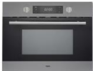
> Pelgrim combimagnetron met turboheteluchtfunctie