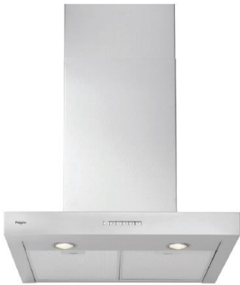
> Pelgrim wandenschouwkap